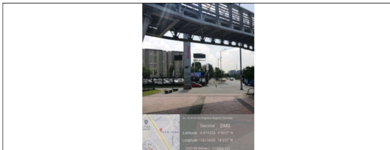
Foto No. 1 –Vista panorámica del predio y de la valla ubicada en la Av. Calle26 No. 81 B 37 (dirección catastral) orientación Oeste-Este