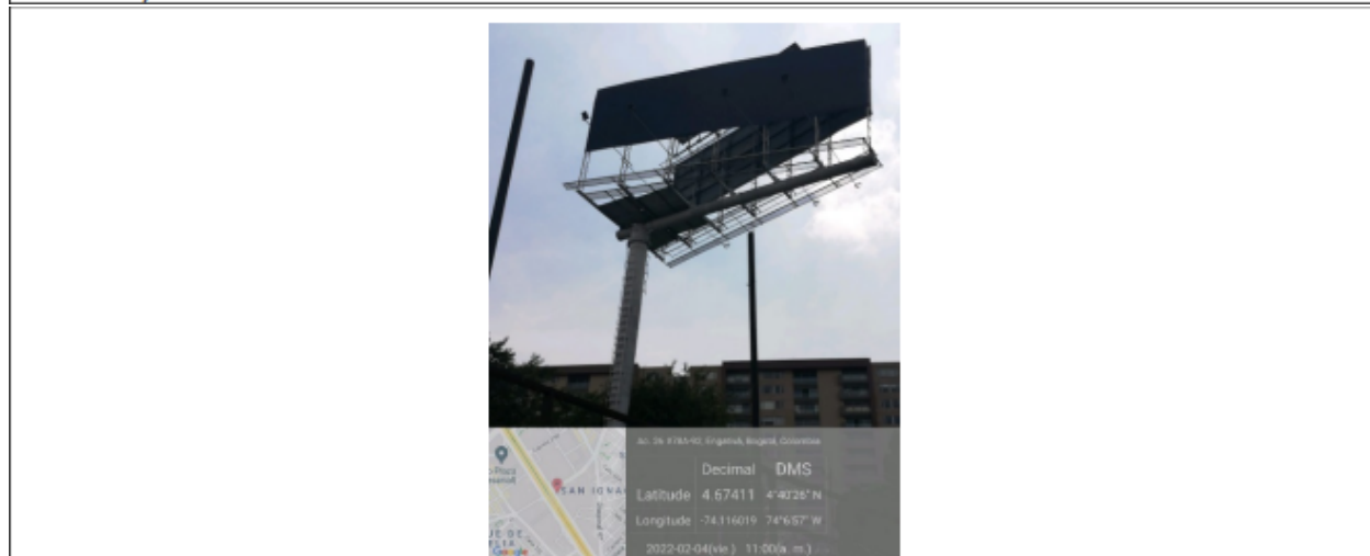
Foto No. 2 – Vista del panel orientación Oeste-Este, actualmente sin publicidad